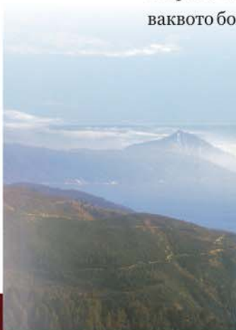
врвот на Света Гора

„Оние што прашуваат духовни луѓе со цел да ја откријат божествената волја треба да го знаат следново: Божјата волја не се открива магиски, ниту пак е релативна, зашто не може да се смести во тесните рамки на човечката логика. Во Својата неизмерна добрина, Бог ѝ снисходи на човечката слабост и му дава на човекот јасно известување. Но, човекот мора прво да Му верува безусловно а потоа и да се смирува копнеејќи ненаситно по познанието на волјата Божја и ревнувајќи во нејзиното исполнување. Затоа човекот го прима со вера и благодарност првиот збор на духовниот отец кому му се обратил за совет. Но доколку овие услови не се исполнети, односно верата, послушанието и смирението не му содејствуваат на човекот - а знак за тоа е кога некој противречи, препрашува или, што е најлошо, бара мислење од други духовници - тогаш Божјата волја се крие од него како сонцето зад облак. Оваа е чувствителна работа и бара големо внимание. Ава Марко вели: 'Човек му дава совет на ближниот по мера на своето знаење; Бог, пак, дејствува во оној што слуша по мера на неговата вера'. Суштински предуслов во барањето на божествената волја е оној што ја бара да покаже спремност да го прими нејзиното откровение, зашто, како што порано веќе реков, божествената волја, која надминува сè, не се содржи на некој магиски начин во какви било положби, места или средства, туку им се открива само на оние што се достоини за ваквото божествено снисходење.“