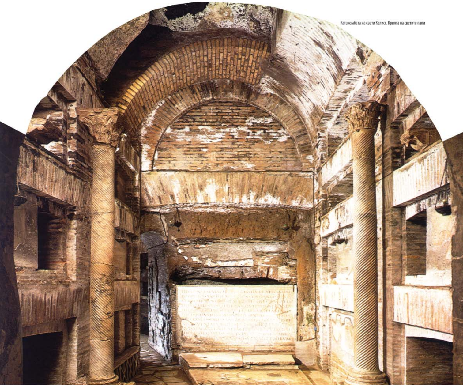
Катакомбата на свети Калист. Крипта на светите папи

Тоа е најважното место во катакомбите кои потекнуваат од 2 век. Таму се погребени 9 папи и веројатно 8 црковни достоинственици од 3 век. На ѕидовите се наоѓаат оригинални натписи на грчки јазик. Тоа сведочи дека првите христијани во Рим биле по потекло од источните земји или наследници на робови коишто дошле од грчки говорни подрачја. Имињата на некои од папите се изрезбани на надгробните плочи. Првиот папа кој бил погребен во оваа крипта е Понтијан (230-235), кој умрел за време на неговиот прогон во Сардинија. Потоа, Антир (пострадал маченички 40 дена по востоличувањето во 236); Фавијан (236-250) кој пострадал маченички за време на царот Декиј; Лукијан I (253-254); Стефан I (254-257); Сикст II (257-258) кој пострадал за време на царот Декиј; Дионисиј (259-268); Феликс I (269-274) и Евтихијан (275-283). Во тоа време римските епископи гинеле еден по друг, така што да се стане епископ во Рим значело да се биде предаден на смрт. Папата Дамас (384) бил последниот епископ погребен во оваа крипта. Тој ги составил најубавите химни посветени на мачениците.