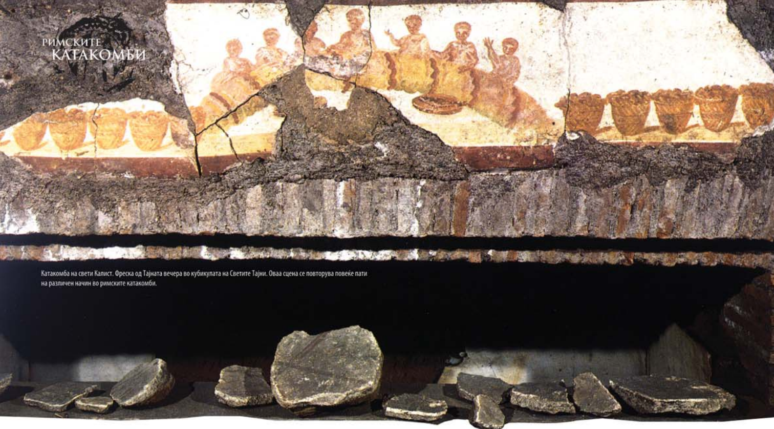
Катакомба на свети Калист. Фреска од Тајната вечера во кубикулата на Светите Тајни. Оваа сцена се повторува повеќе пати на различен начин во римските катакомби.

Првите христијани не ја закопувале својата вера и живот под земјата, туку живееле живот во семејство, во заедница, во сите работи и служби. Христијаните насекаде ја сведочеле својата вера, но токму во катакомбите тие наоѓале сила и поткрепа за да ги издржат искушенијата и прогоните молејќи Му се на Господ и барајќи ги молитвите на мачениците.