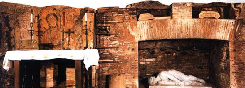
Катакомба на свети Калист. Крипта на света Кикилија. На гробот во поново време е поставена мермерна статуа на света Кикилија во положба во која што таа лежела на тоа место. Ѕидовите се украсени со фрески од 7 и 8 век, меѓу кои од левата страна е прикажан Спасителот.

Во 7 - 8 век целата крипта била украсена со мозаици и фрески. На еден ѕид се наоѓа фреска на света Кикилија на молитва. Во една мала вдлабнатина во ѕидот се наоѓа фреска на Исус Христос со Евангелие во раката. Постојат и фрески на свети папа маченик Урбан, фрески на тројца маченици: Поликам, Севастијан и Квирин.