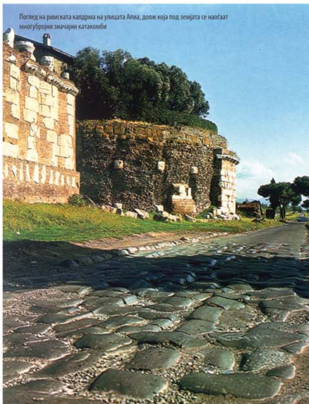
Поглед на римската калдрма на улицата Апија, долж која под земјата се наоѓаат многубројни значајни катакомби