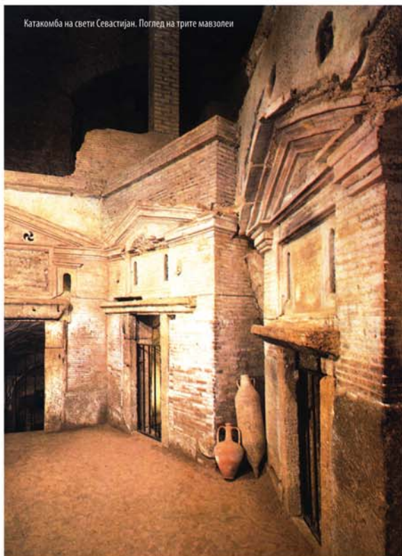
Катакомба на свети Севестијан. Поглед на трите мавзолеи

Во првата половина на 2 век христијаните почнале да ги погребуваат своите починати под земја. Тоа бил почеток на катакомбите: повеќето настанале и се развиле околу семејните гробници чиишто сопственици, новобратените, не ги користеле само за фамилијата, туку ги отворале и за своите браќа по вера. Со текот на времето гробните подрачја се прошириле и под управа на самата Црква.