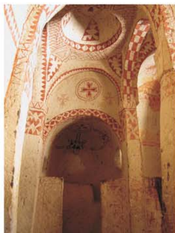
Црквата на света Варвара

Црквите и манастирите од времето на свети Василиј Валики денеска не постојат, меѓутоа сè уште постојат над 400 пештерни црквички, изградени во временскиот период од 5 до 13 век, коишто денеска го сочинуваат музејот на отворено во Ѓереме , светски национален парк што привлекува мноштво посетители од сите краишта на светот. Овој музеј во себе ги вклучува следните храмови коишто се отворени за посетители: „Манастирот Кизлер“, изграден во 11 век; „Црквата на јаболкото“, параклисот на света Варвара, параклисот на свети пророк Даниел, „Црквата на змијата“, „Црквата на сандалата“, параклисот на свети Евстахиј, црквата на Пресвета Богородица, „Скриената црква“, „Црквата на мечовите“ и други. Сите овие цркви меѓусебе значително се разликуваат како по својата архитектура така и по фреските. Покрај едноставните еднокорабни цркви има и големи трикорабни базилики со цели комплекси околу себе. „Темната црква“ (Каранлик) и „Црквата на ременот“ (Токали) се најубави примери на црковна архитектура дури и во границите на византиското царство, заедно со нивните фрески. Византиската уметност има големо влијание на фреските од пост-иконоборниот период. Овие фрески кои датираат од 9 до 13 век биле живописани врз старите и тоа врз малтер направен од кал и слама. Но, овој малтер, бидејќи го немал извонредниот квалитет на вулканската карпа (на којашто биле насликани првобитните фрески од времето и пред иконоборниот период), со текот на времето станал причина за избледување на боите.