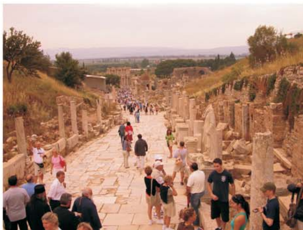
Мермерната улица во Ефес