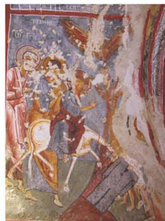
Темната црква (Каранлик)