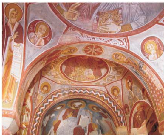
Црквата на јаболкото