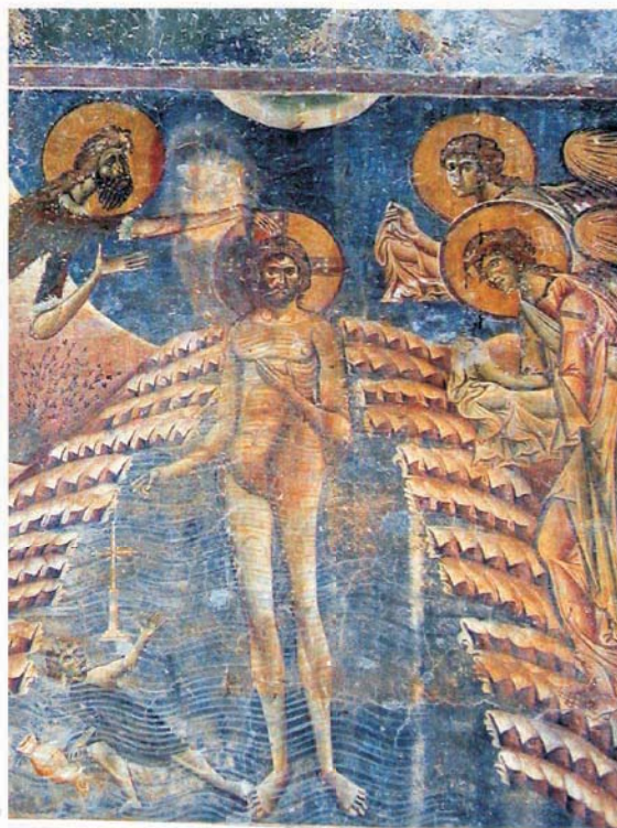
црква св. Георгиј, с. Курбиново, 12 век