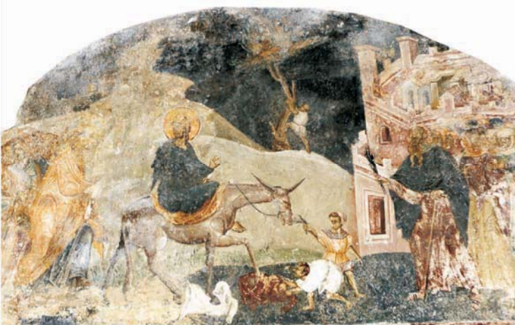
црква св. Георгиј, Старо Нагоричане, 14 век