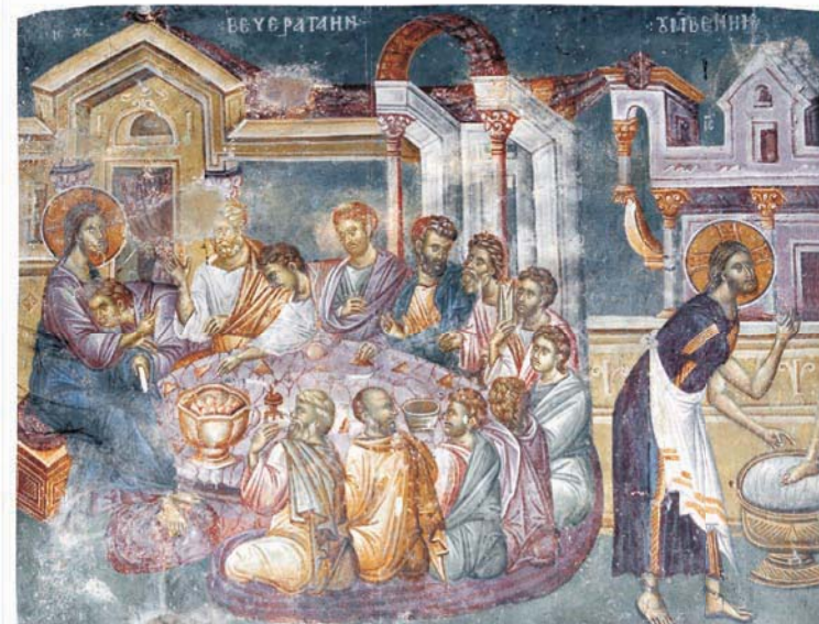
црква св. Никита, с. Бањани, 14 век

Главно за овој значаен ден од Страдалната седмица е дека Господ тогаш ги востанови двете суштествени тајни за нашето спасение: Светата евхаристија (на Тајната вечера: Земете, јадете, ова е телото Мое кое за вас се прекршува за отпуштање на гревовите! Пијте од неа сите. Ова е крвта Моја која за вас и за мнозина се излева за отпуштање на гревовите! Правете го ова во Мој спомен. ) и Исусовата молитва (... Вистина, вистина ви велам: што и да посакате од Отецот во Мое име, ќе ви се даде; И што и да посакате од Отецот во Мое име, ќе ви го направам за да се прослави Отецот во Синот. Ако посакате нешто во Мое име, Јас ќе го направам... ). Со други зборови, на Велики Четврток почнува светотанскиот живот на Црквата. Денот започна со Христовите последни поуки за карактерот на љубовта што треба да ја стекнеме ако сме Негови, Неговото смирение; се памти миењето на нозете на апостолите што го направи Сам: Ако Јас, Господ и Учител ви ги измив нозете, тогаш сте должни и вие еден на друг да си ги миете нозете. А заврши со предавството на Богочовекот Исус Христос на првосвештениците и фарисеите, извршено од Јуда Искариот, еден од бројот на Дванаесеттемина најблиски Христови ученици.