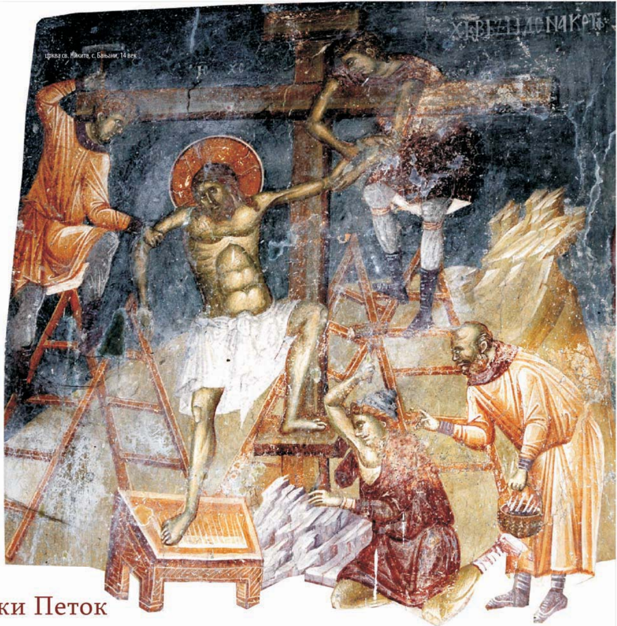
Црква св. Никита, с. Бањани, 14 век