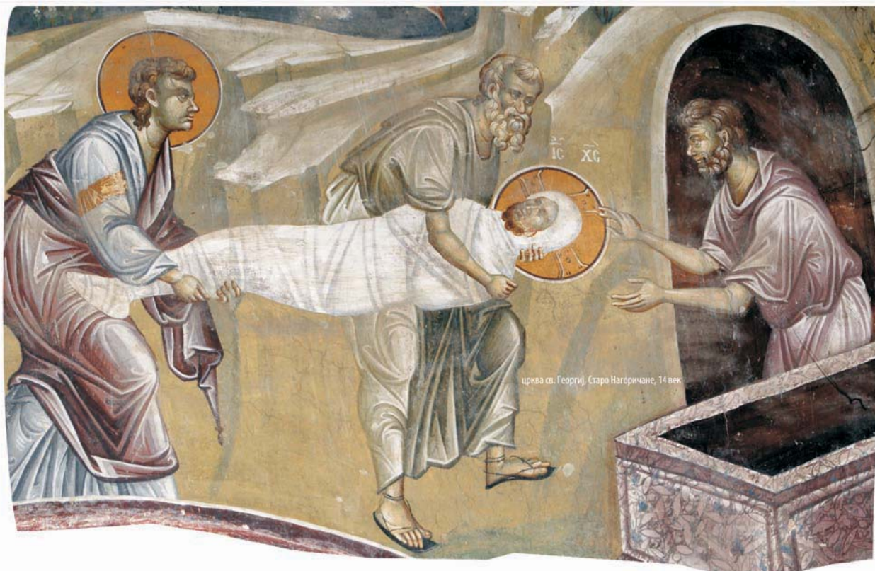
црква св. Георгиј, Старо Нагоричане, 14 век