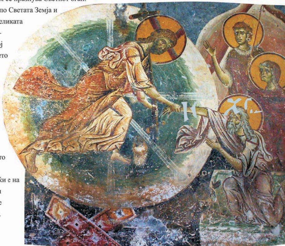
црква св. Георгиј, с. Курбиново, 12 век

ги осветлува сите домови. На денот на великата новозаветна жртва Сонцето на правдата - Христос, го разгорува Светиот оган. Овој празник е востановен со чудото во времето на патријархот Наркисос, кога во недостиг од масло кандилата биле налеани со вода и запалени од оган кој чудесно слегол од небото и за време на пасхалната служба горел како под масло. Древните христијански сведоштва говорат дека незгасливиот оган се чува на Светиот гроб од раните времиња на христијанството. На бдението пред Пасха (Воскресение) во Црквите ширум Православието Епископот, бидејќи е на местото и во образот Христов, самиот ги благословува и ги пали кандилата, а сите други земаат светлина од неговата свеќа.