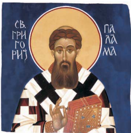
Свети Григориј Палама, архиепископ Солунски