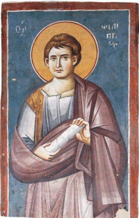
Свети Апостол Филип