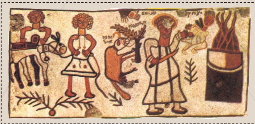
Авраамовата жртва, Бет Алфа, 6 век

Се наоѓаме во опасност да бидеме погрешно сфатени, дека ги пренебрегнуваме каноните. Не! Напротив, сакаме да укажеме дека Црквата, заради тоа што е жив организам, Тело Христово, не само што дозволува, туку и изискува постоење на исто таква - жива врска помеѓу канонското предание и нејзиното светотинско искуство, од една страна, и нејзините организациони и пастирски проблеми од друга страна. Секое место и секое време си имаат свои конкретни потреби. Црквата треба навреме да одговара на тие проблеми.